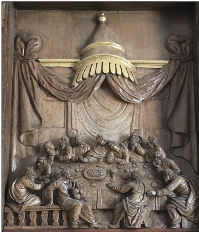
Altertavlens midterstykke. Den stammer fra midten af 1600-tallet og er muligvis lavet på Abel Schrøders værksted i Næstved

Katolikker og ortodokse opfatter nadveren som et offermåltid og mener, at der ved indvielsen af nadverelementerne sker en forvandling af brød og vin til Jesu Kristi legeme og blod.