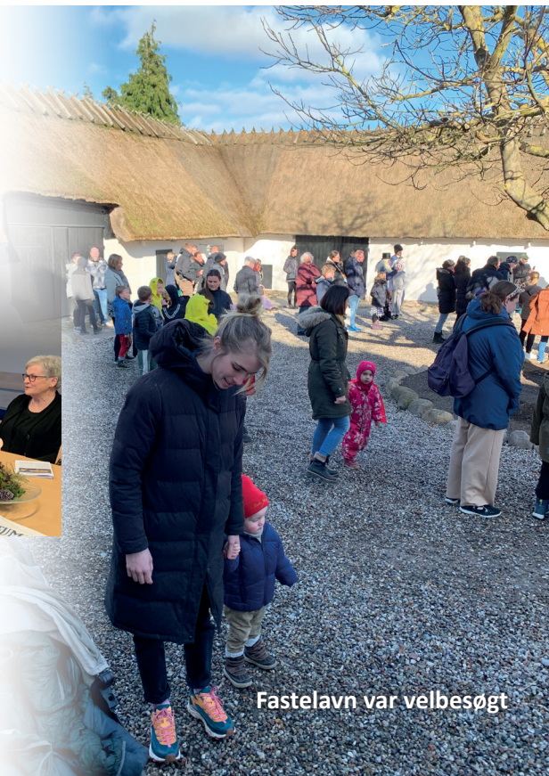
Fastelavn var velbesøgt

Minikonfirmanderne var med til at arrangere gudstjenesten Palmesøndag