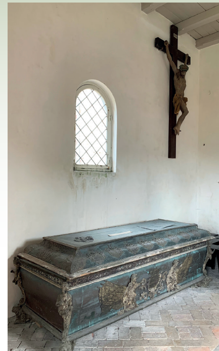
Den ene af de tre kister, der opbevares i kapellet i Næsby kirke.